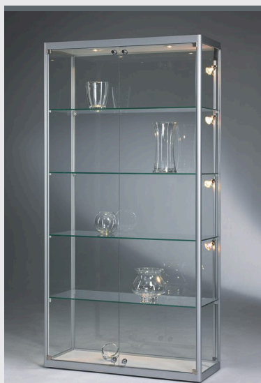
V022.DSG STANDVITRINE MIT GERUNDETEN PROFILEN