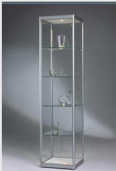
V022.DSL SÄULENVITRINE MIT GERUNDETEN PROFILEN