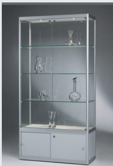
V022.DSU SCHRANKVITRINE M. GERUNDETEN PROFILEN